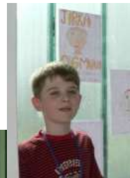
...to jsem já!