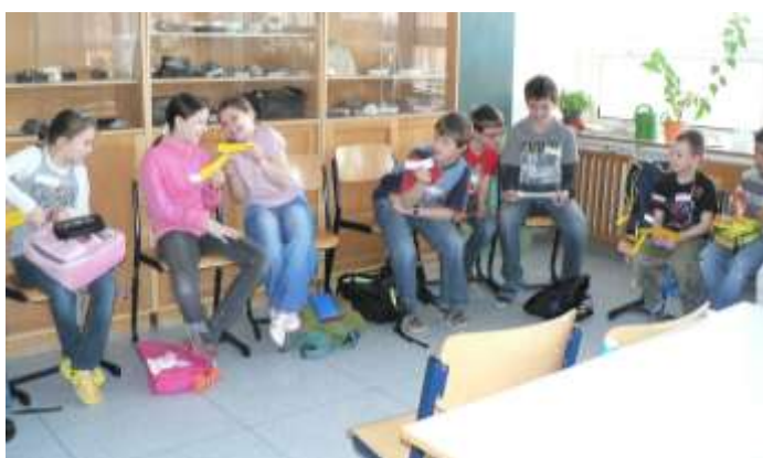
První seznamovací aktivita ve skupinách