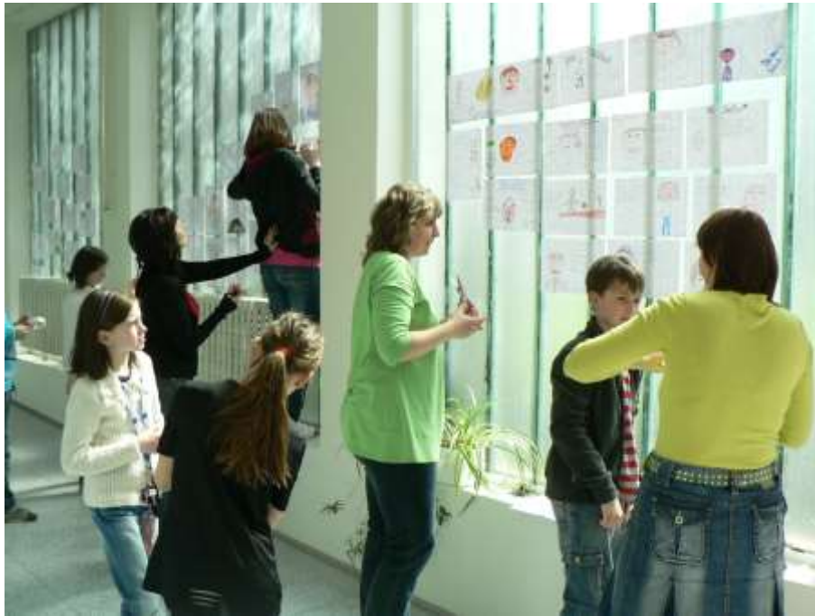
Vystavení vizitek ve spojovacím krčku