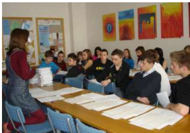
Instrukce pro vedoucí skupin ve sborově školy