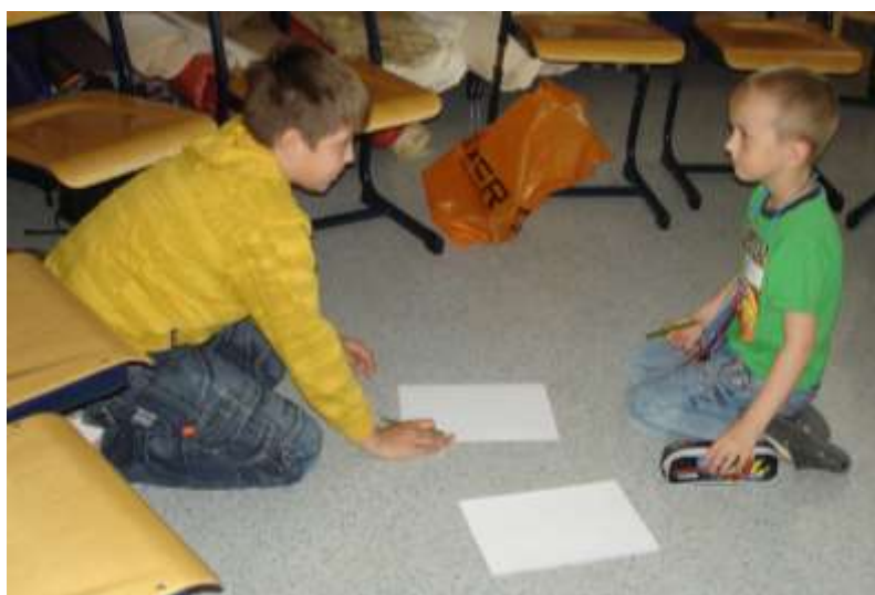
„Uděláme si vzájemně vizitky“ - druhá dílna